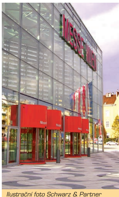
Ilustrační foto Schwarz & Partner

6. 10. 2008, tj. den před Dnem odborných návštěvníků z České republiky