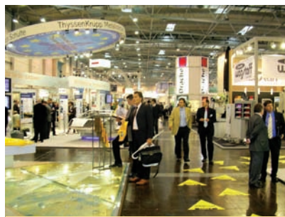
Ilustrační foto Schwarz & Partner

s inovacemi, ale také je to příležitost pro navázání mezinárodních kontaktů s odbornými návštěvníky a delegacemi z různých zemí Evropy. Bohatý doprovodný program VIENNA-TECu se věnuje různým aktuálním tématům a součástí tohoto programu je speciální program pro země střední a východní Evropy, včetně České republiky a Slovenska.